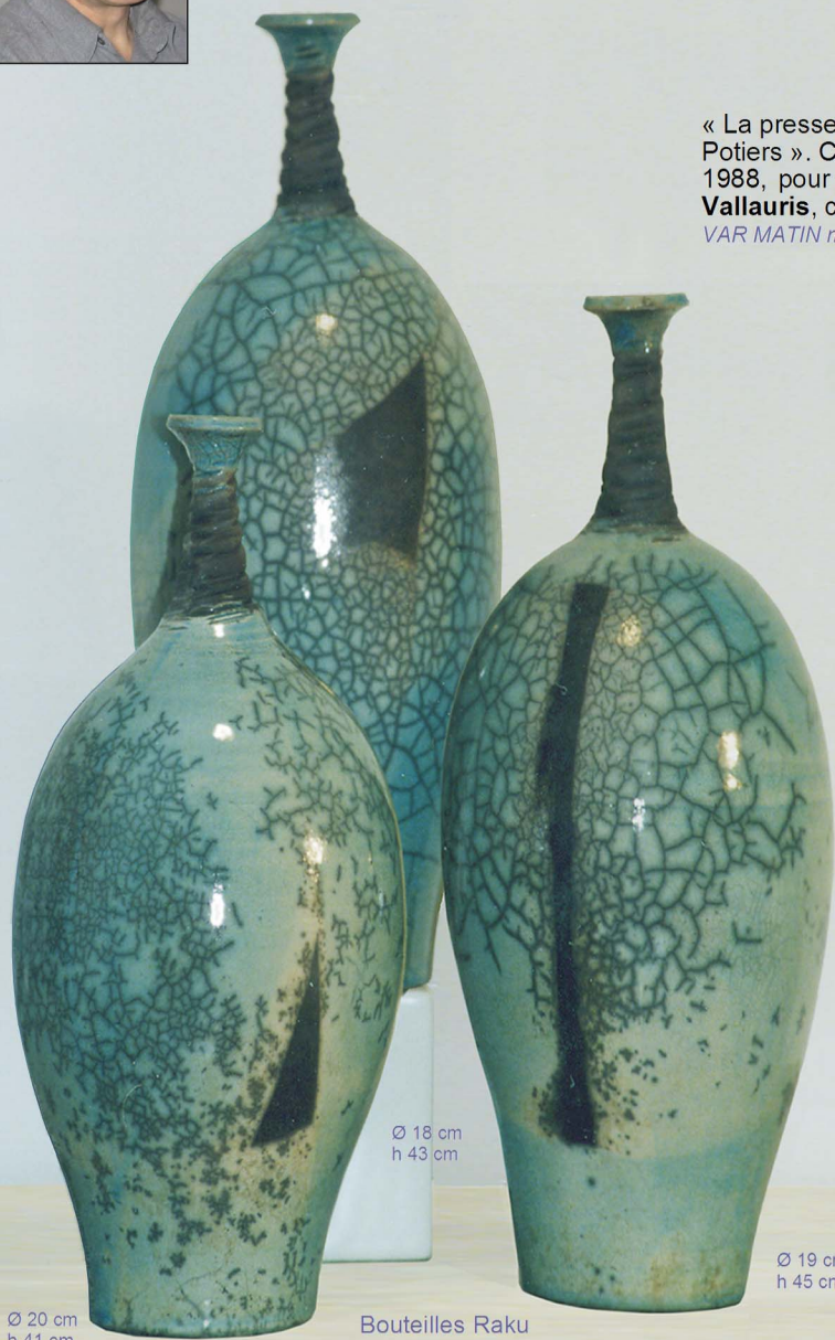
Ø 18 cm h 43 cm