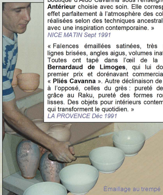
Émaillage au trempé